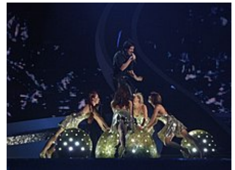
Выступление на «Евровидении-2008» с песней Hasta la Vista

В 2017 году стал Президентом Международного детско-юношеского фестиваля искусств «Талантиада», который проходит во Всероссийском детском центре «Орлёнок» в дни осенних каникул [17] .