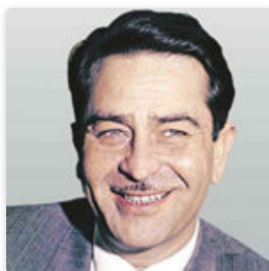
Радж Капур — биография актера