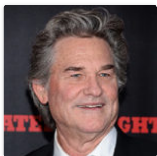
Курт Рассел: биография, карьера, личная жизнь