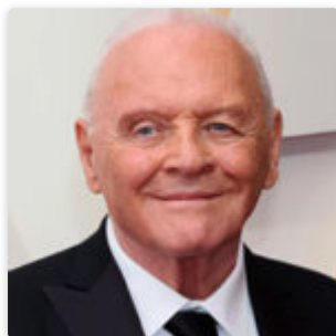
Энтони Хопкинс — биография, награды, карьера, личная жизнь