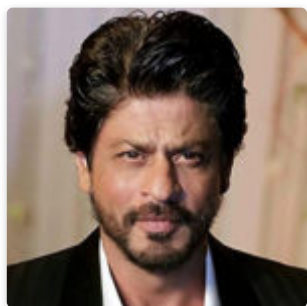
Шахрух Хан — биография актера