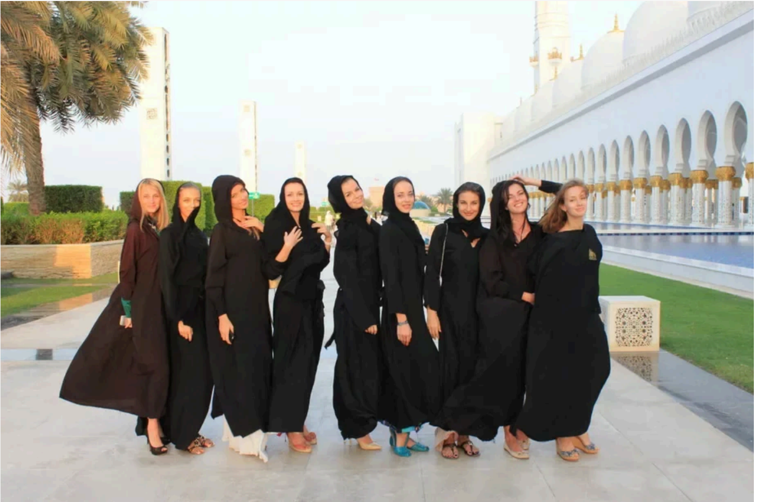
Сотрудницы службы протокола во время официального визита Лукашенко в ОАЭ. Октябрь 2014 года.

Сотрудники «Белпол» подготовили расследование о девушках, сопровождавших Лукашенко во время визита в Объединенные Арабские Эмираты в 2014 году.